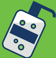
ဆးပွၣ်ဒီး ကသံၣ်ထံသ့ကဆီစု