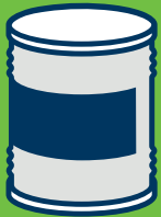
တၢ်အိၣ်လၢ အတဟးဂီၤညီ

ကတၢ်ကတၢ်ပၢ်စၢ တၢ်ဖိတၢ်လံၤလၢလၢအံၤ ၂-နံၣ် အဂီၢ် လၢနၢဒီးနဟံၣ်ဖိယိဖိအဂီၢ်တက့ၢ်.