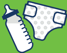
ဖိသၣ် တၢ်ဖိတၢ်လံၤ ပီးလိတဖၣ်