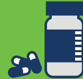
ကသံၣ်တဖၣ်လၢ နကလိၣ်ဘၣ်အံၤ ဖဲနအိၣ်တဆုၣ်အခါ