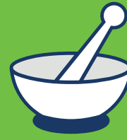
ကသံၣ်လၢ နအိၣ်နီၤအံၤ