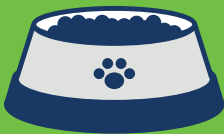
ဆၣ်ဖိကီၢ်ဖိ တၢ်အိၣ်ပီးလိတဖၣ်